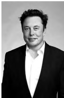
Figuur 1: https://en.wikipedia.org/wiki/